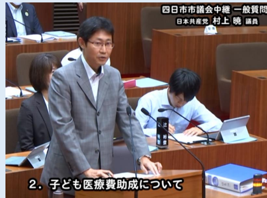
写真は6月定例会議会 一般質問(2023年6月15日)

こども未来部長は、「子ども医療費助成の年齢拡大は有効な子育て支援策であり、検討したい」と答弁しました。この流れの中で、今回医療費助成の対象拡大が実現しました。